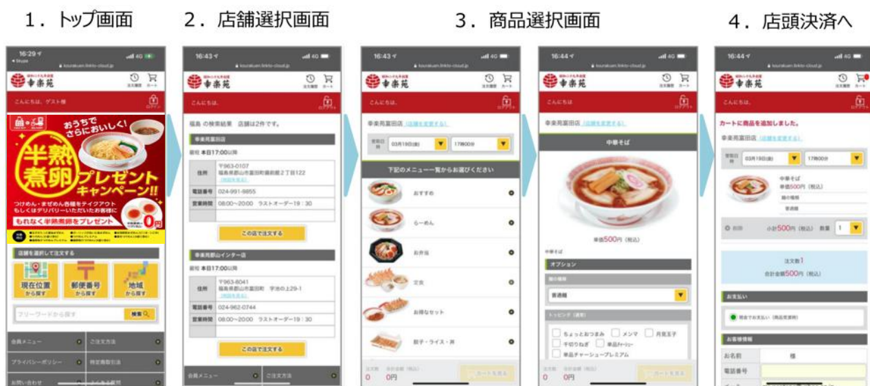
モバイルオーダー 画面イメージ

1. 店舗選択 → 2. 商品注文 → 3. 店頭決済 → 4. 店舗で受け取り