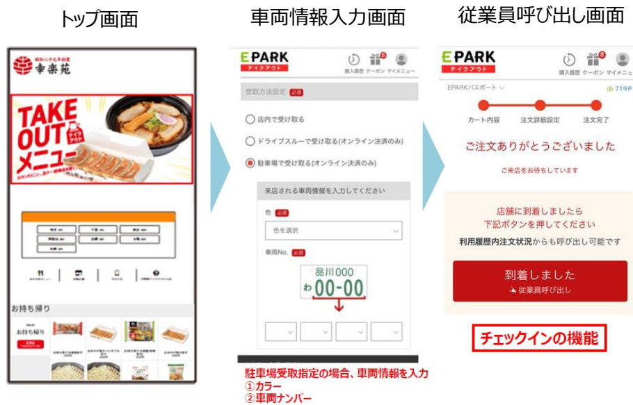
EPARK テイクアウト 画面イメージ

1. 店舗選択 → 2. 商品注文 → 3. 事前決済・店頭決済 → 4. 車両情報を入力（車のカラー・車両ナンバー） → 5. 店舗駐車場に到着後、「到着しました」のボタンをクリック → 6. スタッフができたての商品を、お車でお届け