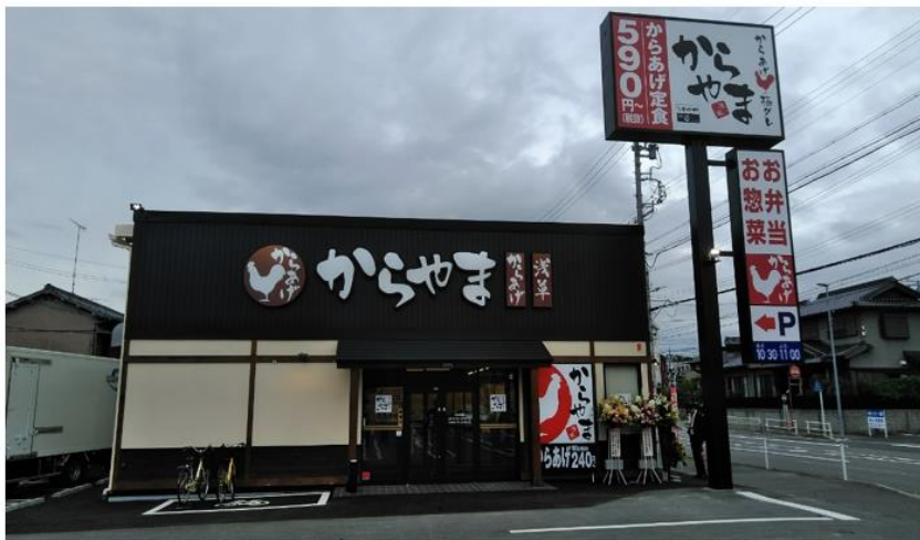
9月13日にオープンしたからやま FC 第1号店「からやま岡崎伊賀店」