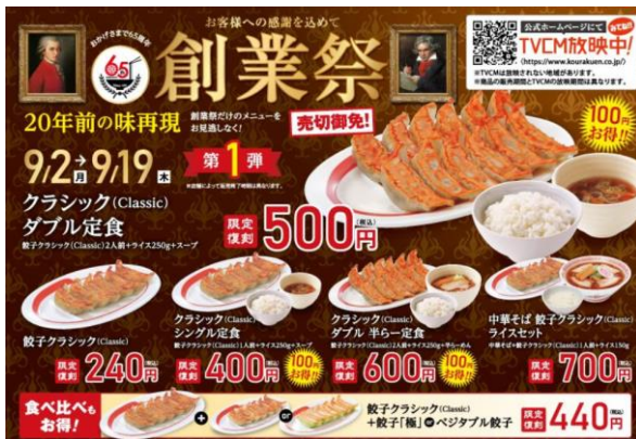
20年前の味を再現した「餃子クラシック」