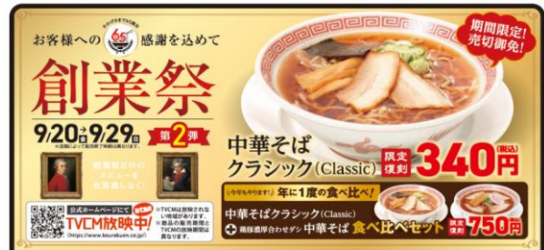
長きに渡り愛された看板商品「中華そばクラシック」