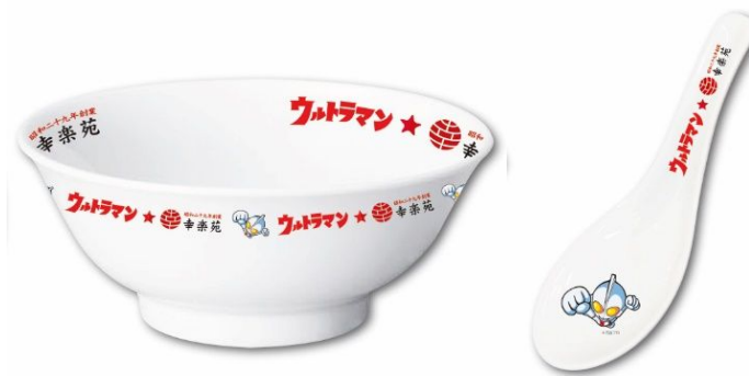
特製ウルトラマンラーメンどんぶり&レンゲセット（販売用）