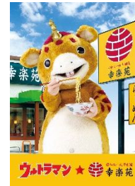
快獣ブースカ バージョン