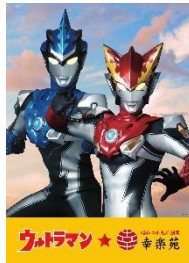
ウルトラマン平成 バージョン