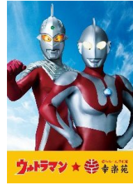
ウルトラマン昭和 バージョン